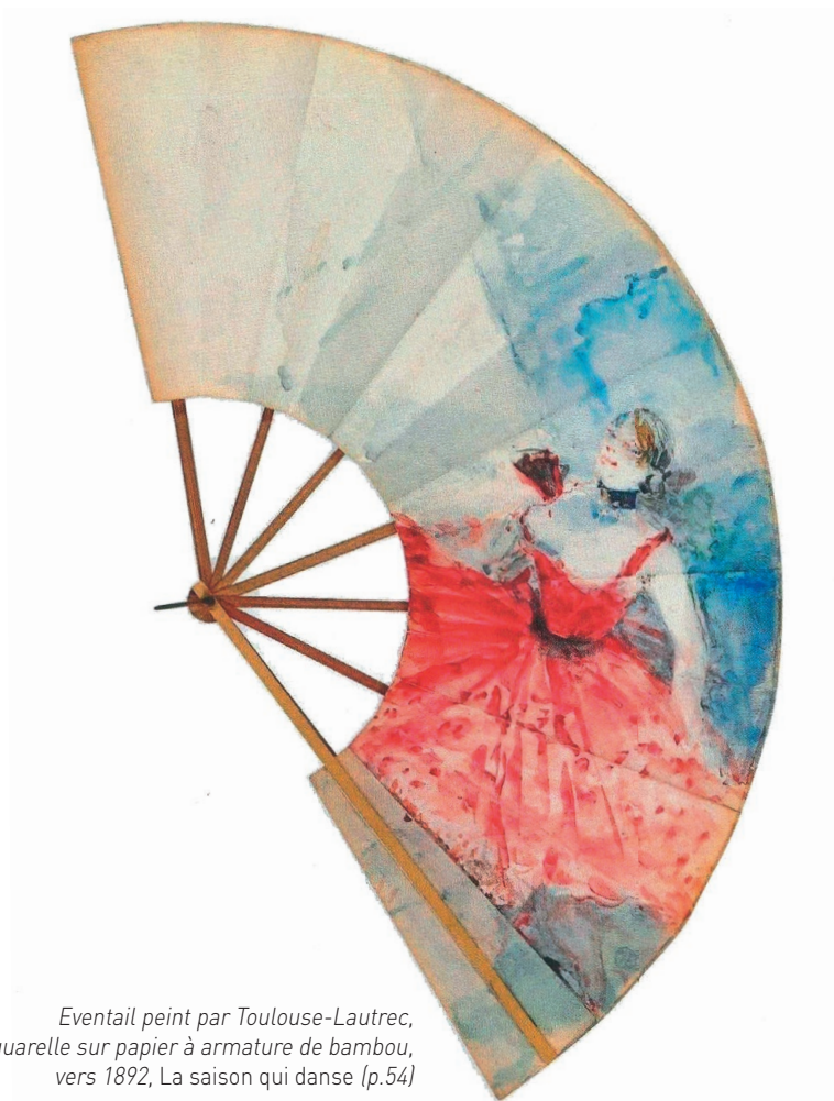
Eventail peint par Toulouse-Lautrec, aquarelle sur papier à armature de bambou, vers 1892, La saison qui danse (p.54)

Au gré des circonvolutions thématiques, le parcours choisi par l'auteur enchante son lecteur qui, feuillet après feuillet, savoure son réel plaisir ; jouissance de l'œil qui goûte une aquarelle, une huile, un croquis ; régal procuré par la poésie